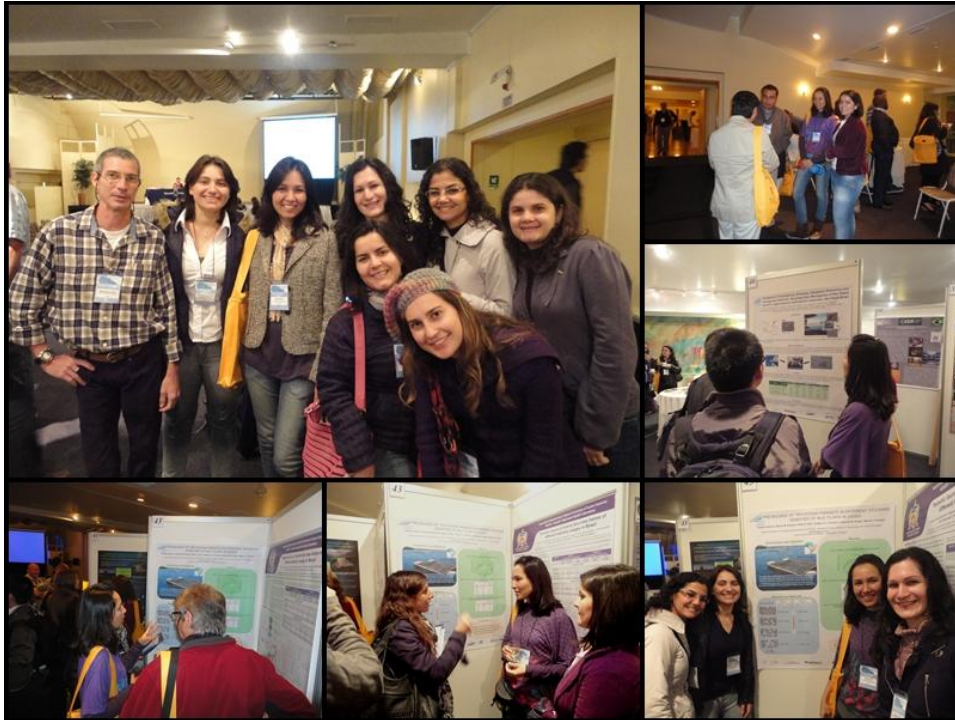
Figura 1. Congressistas brasileiros da APTA, da UNESP de Botucatu e da Universidade Federal de Santa Catarina no 8º International Symposium of Fish Parasite, em Viña del Mar, Chile. Discussões com conferencistas estrangeiros.

produto, que não causa impacto ambiental. O pesquisador Van As, da África do Sul, propôs parceria científica para estudos da taxonomia dos protozoários parasitos do gênero Thichodina , expostos nos painéis.