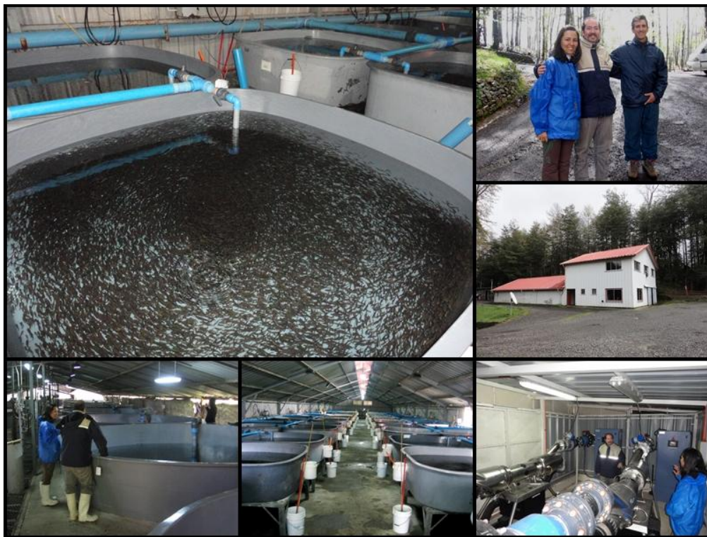
Figura 2. Visita ao setor de alevinagem da AquaChile, localizado em Caburga, Chile. Responsável Técnico: Patrício Alfaro Villagra.

Todo o efluente é filtrado antes de ser devolvido ao corpo d'água adjacente à piscicultura. Com os peixes mortos, faz-se silagem, que é encaminhada à fábrica de farinha de peixe.