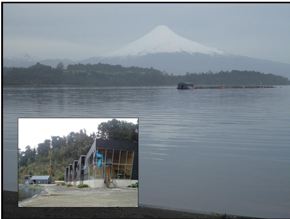
Figura 3. Visita à piscicultura Multiexport, às margens do Lago Llanquihue, Puerto Octay, Chile. Ao fundo, o vulcão Osorno.

Esta unidade recebe os ovos embrionados, os incuba até a eclosão e realiza alevinagem (peixes até 40 g). Toda esta etapa é realizada em sistema de recirculação de água, com renovação máxima diária de 5 % do volume total. Este sistema possui bombas de radiação UV que reduzem a carga microbiana da água, eliminando por conseqüência, a ocorrência de enfermidades.